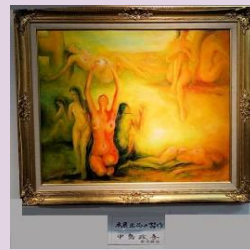
光の舞 中島 政吾