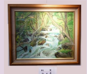
静かな風景 谷 正幸