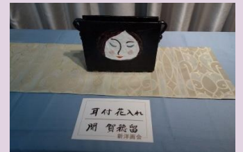
静かな風景 関 賀穂留