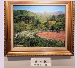
静かな風景 中村 五一郎