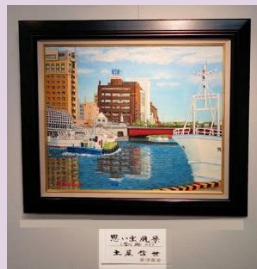
静かな風景 土屋 哲世