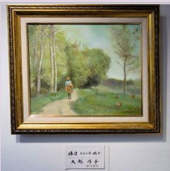
静かな風景 大越 淳子