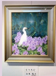
静かな風景 山本 節子