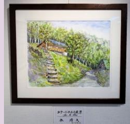
静かな風景 本 靖夫