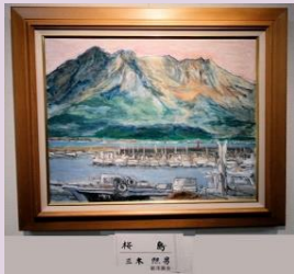
秋の山 三木 照男