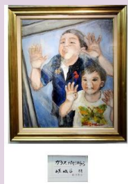
静かな風景 嵯峨谷 梢