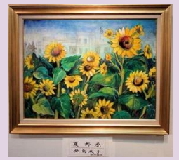
夏の花 倉島 米子