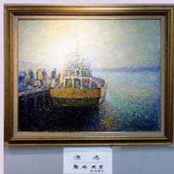
静かな風景 鳥塚 次男