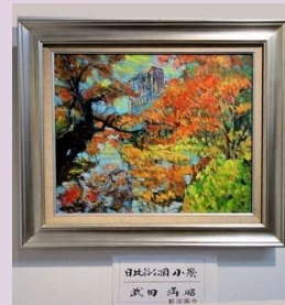
静かな風景 武田 満昭