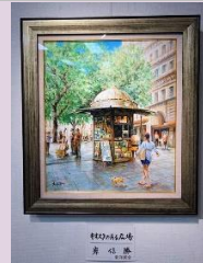
静かな街角 岸 信勝