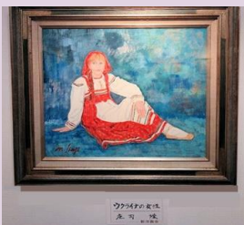
静かな風景 庄司 陸