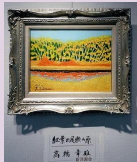
静かな風景 高橋 幸雄