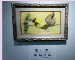
静かな風景 塚越 澄江